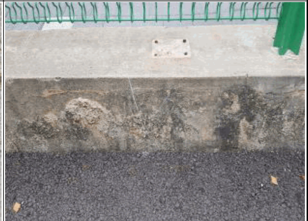
② 경계점표지 위치(사진)