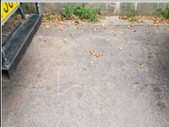
③ 경계점표지 위치(사진)