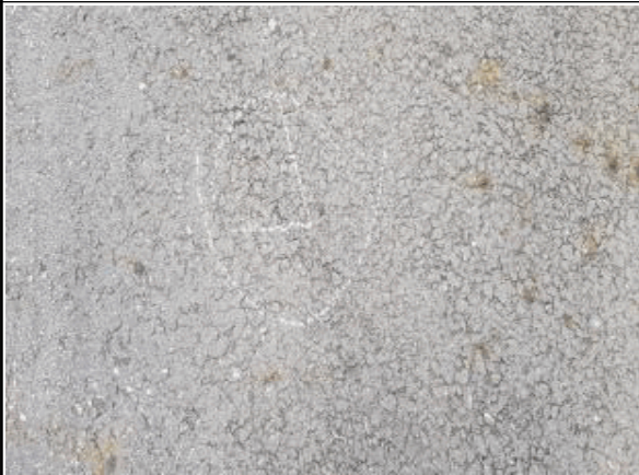
① 경계점표지 위치(사진)